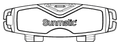
Rear Operation Button